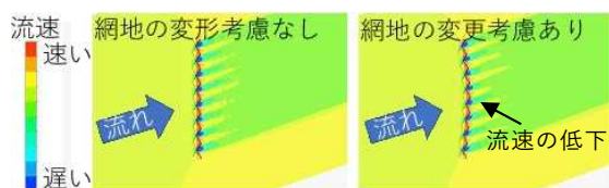
図1 網地の変形と流速

コンピュータを用いて漁具にかかる抵抗を計算することで、漁具の設計に要する時間と費用が節減されます。また、省エネ要素技術ごとに燃油消費量の削減効果と漁獲量の減少を予測することで、利益が最大になる条件を選択できます。これらにより省エネ型漁具の開発と導入が進み、漁家経営が向上することが期待されます。