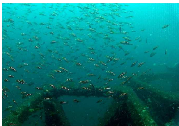
図 1. 調査の対象とした魚礁ブロックに群れるイサキの様子

環境 DNA 分析で魚礁に出現する魚類を確認することができ、魚礁の効果評価への活用が期待されます。一方、潜水観察で確認されなかった種が環境 DNA 分析で検出されたため、周辺からの排水などの影響が考えられました。この手法を用いる際は、調査地の位置などを考慮する必要があります。