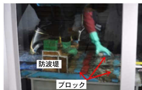
写真 3 作業風景の一コマ