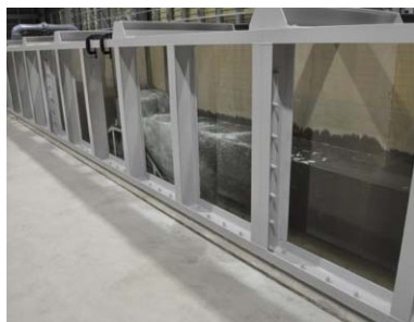
写真 1 津波実験水路

今後、様々な実験を実施して技術的知見を収集し取りまとめ、設計に反映させることで、津波に対する防災・減災に資する漁港施設や海岸保全施設の整備への貢献が期待されます。