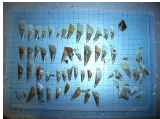
養殖バッグで採取された稚貝